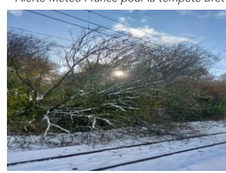
Photos d'illustration prises sur les lieux impactés par les événements.

Ces événements climatiques successifs, indépendants des Trains Nomad, ainsi que des chocs avec des animaux sauvages, ont fortement impacté vos trajets sur cette période malgré la forte mobilisation des équipes jour et nuit pour rétablir les circulations et assister les voyageurs durant les très longs temps d'attentes.